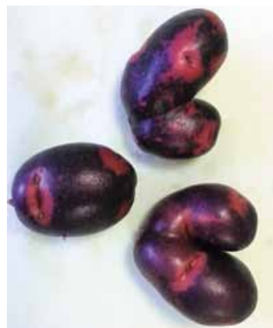
『デストロイヤー』 芸濃町北神山 ベジタブル8さん 今年初めて挑戦。デストロイヤー（じゃがいも）懐かしい名前です。