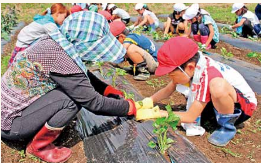
▶サツマイモのつるを定植する児童（右）と生産者（左）

地元農家から芋のでき方や植え方を教わると、さっそく畑に入っつるを寝かして植えました。体験した児童は「いつも食べているサツマイモは根が大きくなったものだとわかった。焼芋を早く食べたい」と話していました。