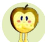
ジューシー なしやま