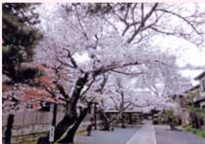
津市栗真町屋町 チュン