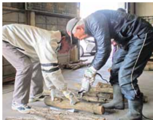
▲原木にドリルで穴を開ける参加者

栗真地区運営協議会は3月12日、栗真集荷場で「シイタケ栽培講習」を開きました。参加した31人は講師から植菌の仕方や管理の方法などを学ぶと、原木に電動ドリルで穴を開け、金槌でシイタケの菌を打ち込みました。収穫は植菌2年後になります。