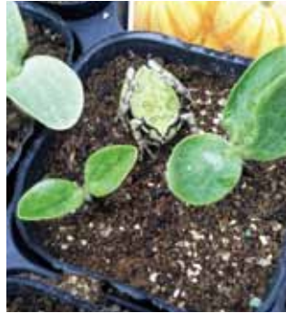
『見張ります』 芸濃町北神山 ベジタブル8 いつの間にかカエルが苗の生長を見てます。