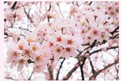
河芸町三行 ひまわりばあば