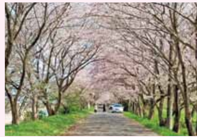
芸濃町椋本 むくじいちゃん