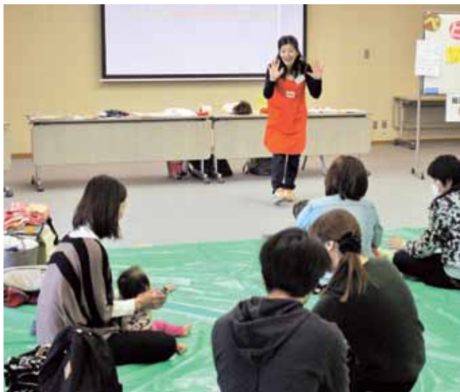
▲ベビーサインを体験する会員

集いには日本ベビーサイン協会の講師が言葉を話す前の会話「ベビーサイン」を使った手遊びや歌を紹介し交流しました。