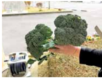
『地産地消』 美里町北長野 まさまこ

中野文化センターで職員が愛情込めて育てた20センチ?くらいのブロッコリーが誕生しました。美味しく皆でいただきました。