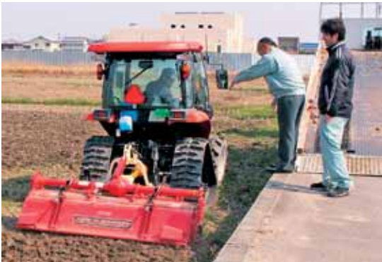
▲モデル地域で耕起作業を始めた株)ジェイエイ津安芸社員

水稲栽培作業が始動 株)ジェイエイ津安芸 農業部 JA津安芸の子会社株)ジェイエイ津安芸が、4月から農業経営事業を本格的に始動しました。株)ジェイエイ津安芸は農業経営ができるよう平成28年7月に定款を変更し、農業部を新設しました。これまで当JAの営農対策部営農企画課がモデル地域の地権者に説明会を開き、初年度は試験的に農地2haを子会社が借り受け水稲の生産販売を行います。今後も規模拡大と、管内地域農業の維持、振興、優良農地の保全に取り組みます。