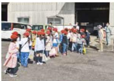
▲熱心に説明を聞く児童

津南部支店では、組合員・地域の皆さまとの「ふれあい」を通じて地域に密着した店舗作りをめざし、「CCC活動」に取り組んでいます。