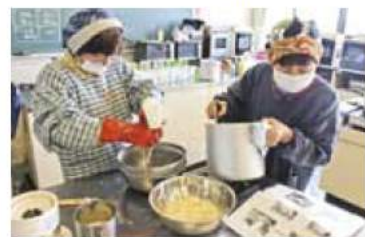
▲呉を力いっぱい絞る部員