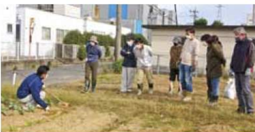
▲中耕の方法を学ぶ塾生

今回は害虫の被害にあった野菜もあり、講師にアドバイスを受けこれからの生育に向けて作業しました。