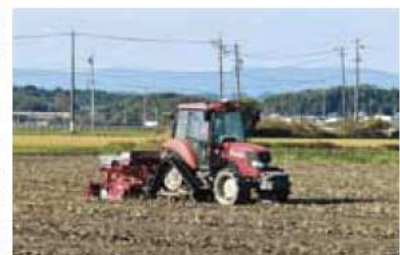
▲自動操舵での麦の播種作業

小麦栽培は津地域農業改良普及センターやJA営農担当職員の指導、情報提供により取り組んでいます。