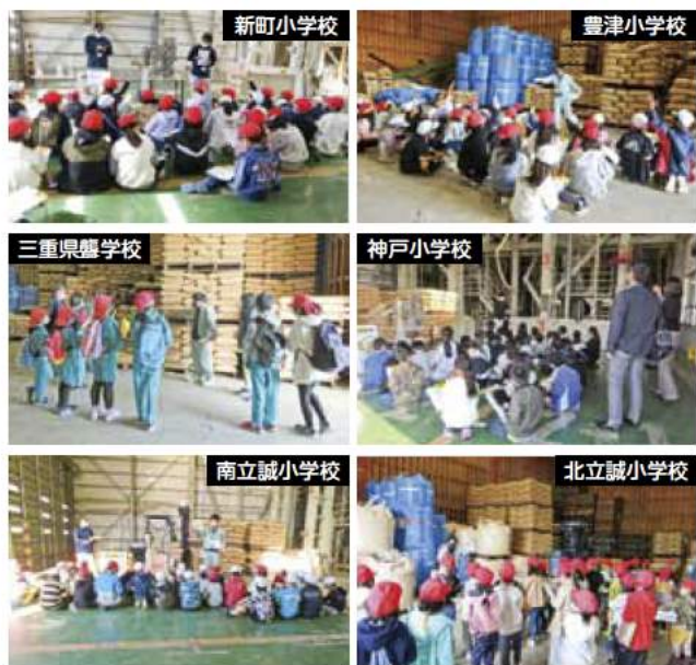
▲たくさん学習してメモをとる児童

管内で収穫した粉の荷受けから精米になるまでの工程や米倉庫での保管方法について説明を受け、粳や玄米・白米を実際に見比べました。自分たちがいつも食べているお米がどのように作られているかを学びました。