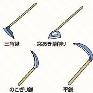
図3 除草、土寄せ作業

草刈りには平鍬を使います。伸びてきた草を片手でつかみ、鍬先を地際から手前に引いて切断します。のこぎり鍬は、堅い草を刈るのに向いています。