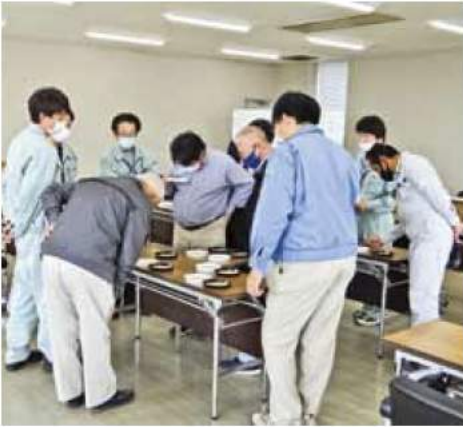
▲玄米を確認する参加者

説明の後、生産者別に米検査用カルトンに置かれた三重23号の玄米を前に、意見交換などを行いました。