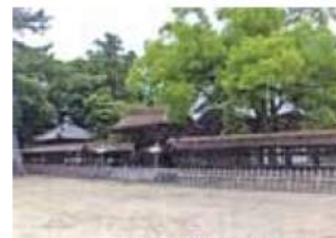
7. 御廟唐門及び透塀