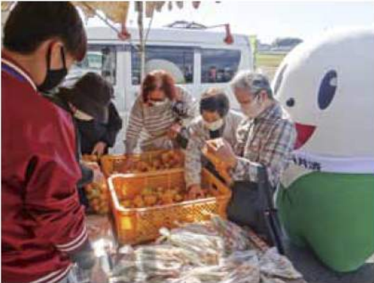
▲みかんの詰め放題を見守る「ミー・ユ」

開催中には、日頃のご愛顧に感謝してイベントも実施し、当JAのマスケットキャラクター「ミー・ユ」の登場や当JA管内で生産されたコシヒカリ100%使用のプライベート米「安濃津ロマン」のお試し袋や紅白餅をプレゼントしました。