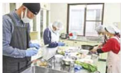
▲指導を受けながら作業する参加者

参加者は「今回の経験で料理することが楽しく感じた。また家でも作ってみたい」と話しました。