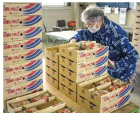
▲出荷作業を行う生産者

また、芸濃営農センターでも芸濃いちご部会の生産者らが収穫したばかりのイチゴの検品、出荷作業を行い市場へ出荷しました。出荷は5月まで行う予定です。