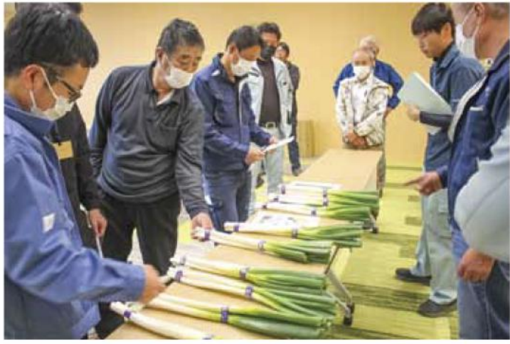
▲白ネギの出荷規格を確認する生産者

12月8日、ネギ生産部会は本店で白ネギ目ぞろえ会を開催し、生産者や津地域農業改良普及センター、市場関係者、当JA営農担当者ら13人が参加しました。 目ぞろえ会では、今年の生育状況や市場情勢などの説明の他、出荷時の注意点を確認し、規格・等級の統一を図りました。 市場関係者は「品質管理を徹底して、高品質な出荷をめざしてほしい」と呼び掛けました。