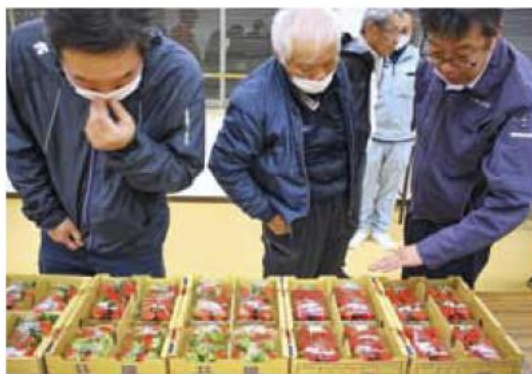
▲イチゴの色や形を確認する生産者