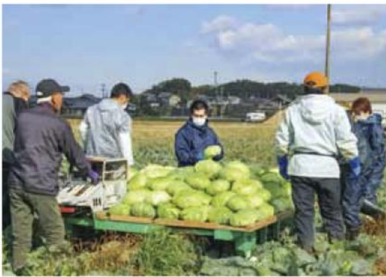
▲収穫したキャベツを台車に積み込む利用者