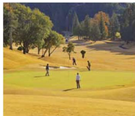
▲プレーを楽しむ参加者