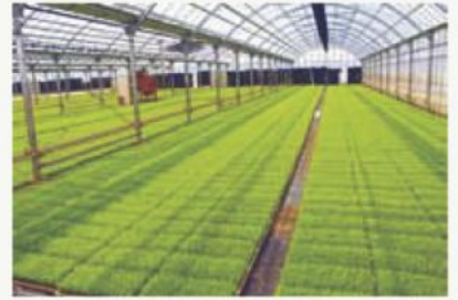
※緑化苗は安濃育苗センターでコシヒカ リのみ取り扱いとなります。 ※左記表は、精算時の価格となります。

(はじめて育苗センターをご利用される方でご不明な点は、各営農センター へお問い合わせください)