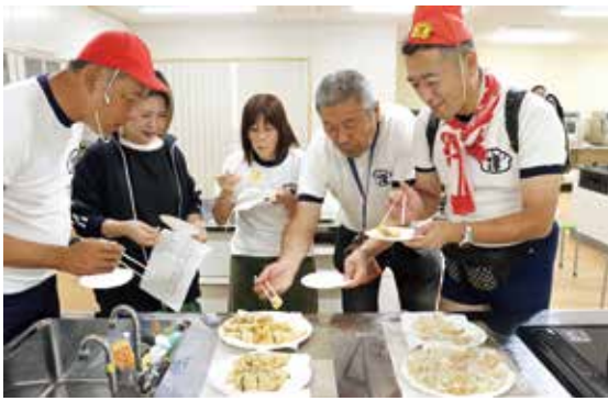
◀高虎ねぎ入り「津ぎょうざ」を試食する津ぎょうざ小学校メンバー