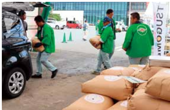
◀予約の玄米を引き渡すJA職員

地元産の大豆「サチユタカ」を前日から浸水して下準備し、当日はミキサーで豆を粉砕して煮た後、こし袋で絞って豆乳とおからを分けました。豆乳は80℃まで温め、にがりを入れて準備した再利用ペットボトルに入れ、しばらく置いてよせ豆腐が完成しました。今回は新たな試みとして、フライパンを使った「ゆば作り」にも挑戦。できたての豆腐や豆乳とともに試食しました。