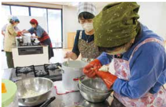
◀こし袋を絞る参加者