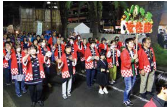
◀揃いの法被姿で元気に踊る参加者