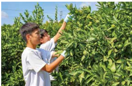
◀ミカンを摘果する生徒