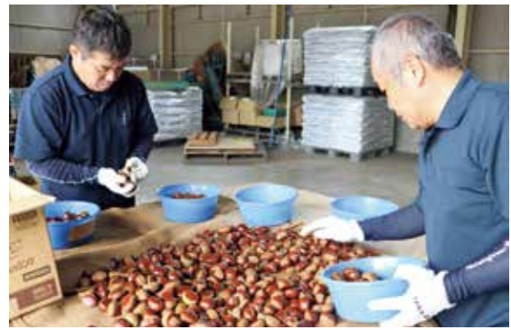
◀栗を選果する職員